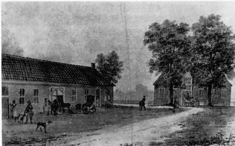
Afb. 1. De Stifhuizen te Weerselo. Aquarel van Aart Schouman, 1769.