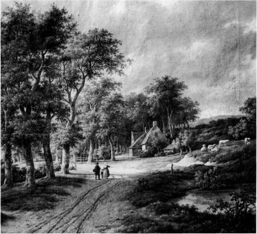
Detail van een olieverf op doek door Adrianus Serné, 1847 (coll. Stedelijk Museum Zwolle).