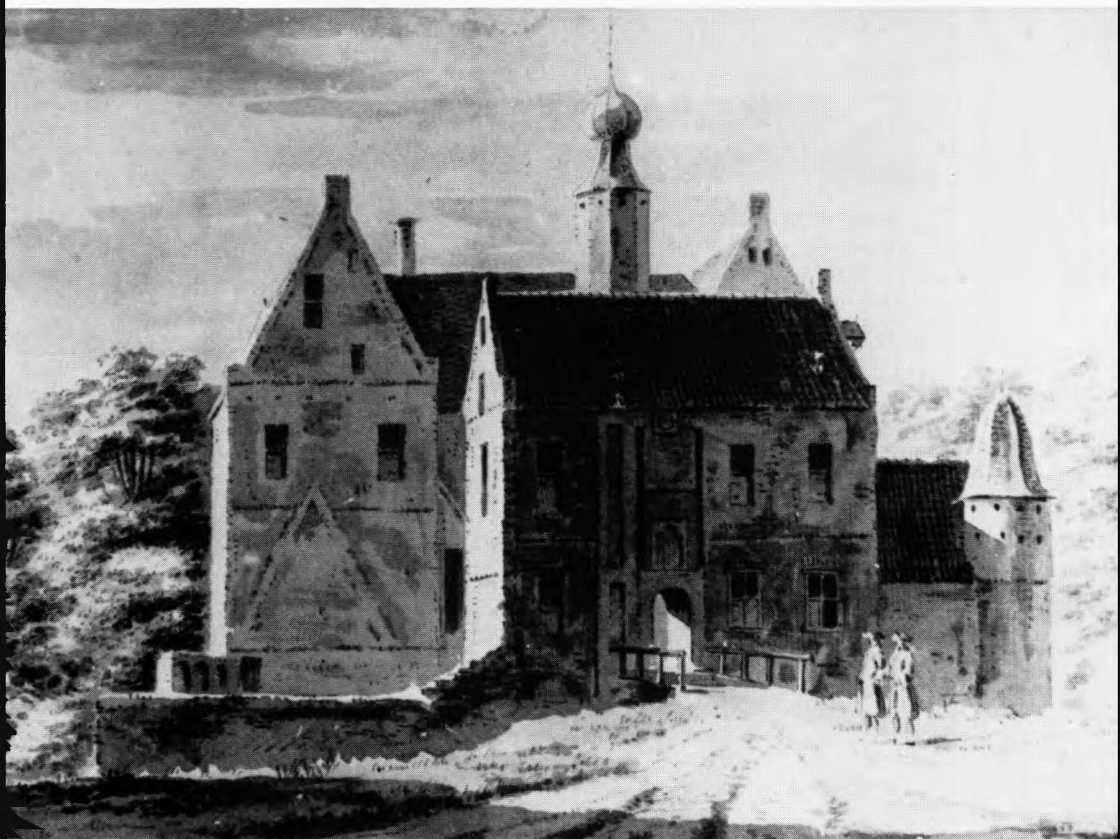
Slot Saasveld 1729. Pentekening A. de Haen toegechreven. Provinciaal Overijssels Museum, Zwolle.