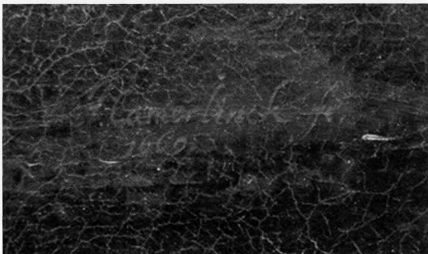
Detail met de signatuur J. Camerlinck.

natuur gelezen als F. Camerlinck. Een F. Camerlinck is echter niet in de archieven te vinden. Daarom werd de maker van dit schilderij in de museumdocumentatie vermeld als 'F. Camerlinck, onbekende schilder'. In het verleden is de voorletter echter ook voor een J. aangezien. Onder deze signatuur staat het jaartal 1660. Met lamp en vergrootglas is onlangs opnieuw de signatuur bestudeerd. De initiaal lijkt meer op een J. dan op een F.