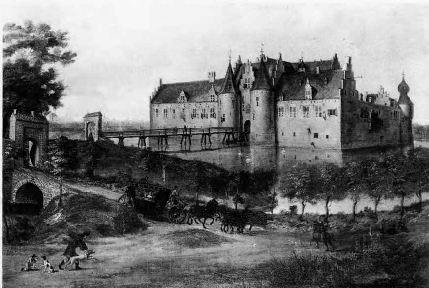
De Toutenburg, J. Camerlinck, 1660, olieverf op linnen, inv.nr. 365.

Het schilderij is gesigneerd en gedateerd, maar de signatuur is in de loop der jaren op verschillende manieren geïnterpreteerd en gelezen. Over de familienaam van de kunstenaar bestaat geen twijfel: Camerlinck. Jarenlang is de sig-